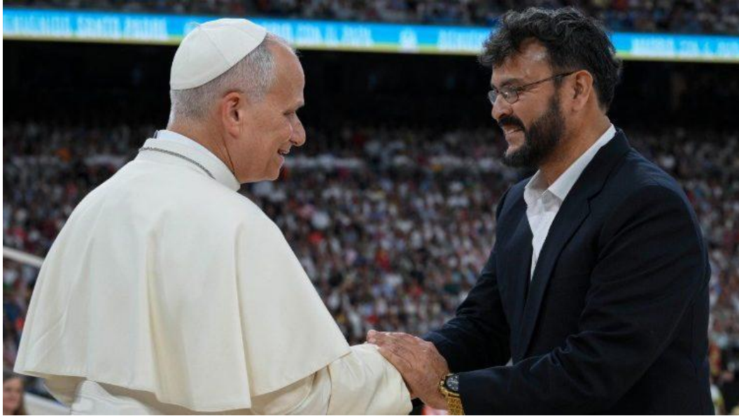
Đức Giáo Hoàng Lêô XIV tại Sân vận động Bernabéu ở Madrid