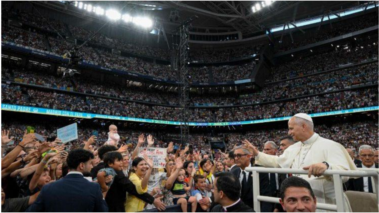
Đức Giáo hoàng Lêô XIV tại Sân vận động Bernabéu ở Madrid