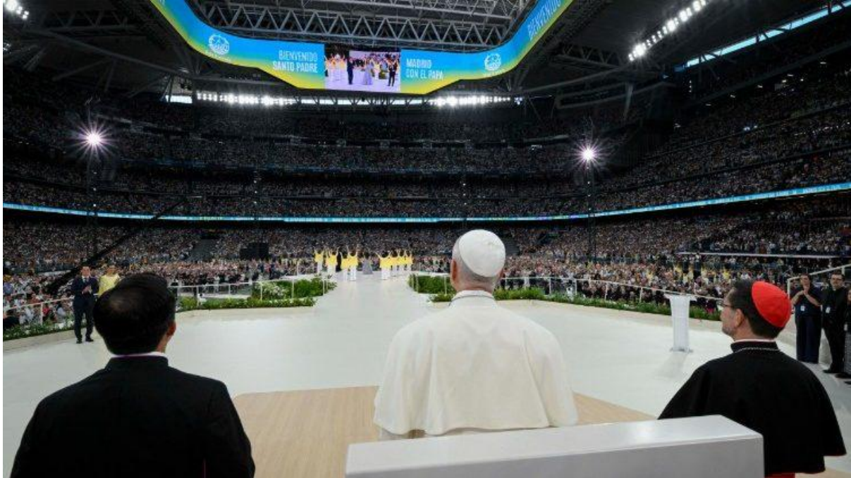
Đức Giáo Hoàng Lêô XIV tại Sân vận động Bernabéu ở Madrid

Những câu chuyện về đức tin, phục vụ, phân định, sự chào đón và hoán cải của họ đã tạo nên bối cảnh sống động cho những suy tư của Đức Giáo Hoàng về sự hiệp thông, truyền giáo và ơn gọi truyền giáo của Giáo Hội trong xã hội đô thị đương đại.